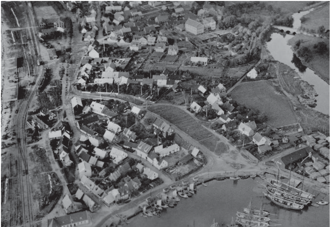
Flygfoto med Nedre Läget nere tv och delar av Övre Läget.

Nu gör vi vår vandring i Skepparegatan och i Kaptensgatan, tidigare Hamngatan.