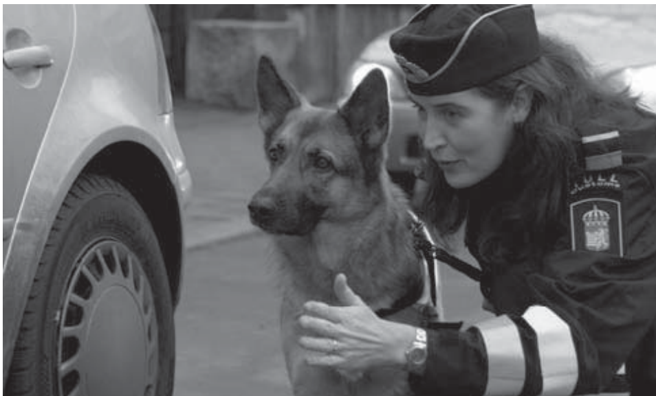
Narkotikahund i arbete.

Lots, tull, kustbevakning och sjöräddning står i fokus för Råå Museums stora säsongsutställning som invigs 1 maj. Ofta ser vi deras båtar ute i Sundet; lotsbåten på väg med lots till väntande fartyg, sjöräddningens röda som fräser fram till sitt uppdrag, Kustbevakningens blå... alla hjälper de till att hålla koll på Läget.