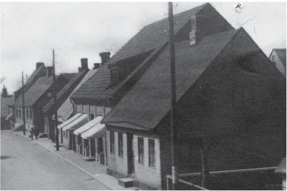
Kooperativet Svea (till vänster med markiserna). Bilden från ca 1918.