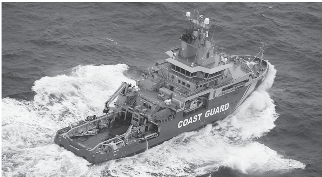
Kustbevakningens KBV002 på provtur i Svarta Havet.

Betydligt mer får du veta på sommarens utställning. Vi hoppas på välbesökta dagar när Tullen visar upp sig, och förhoppningsvis sina skickliga sökhundar, den 10 och 11 juli.