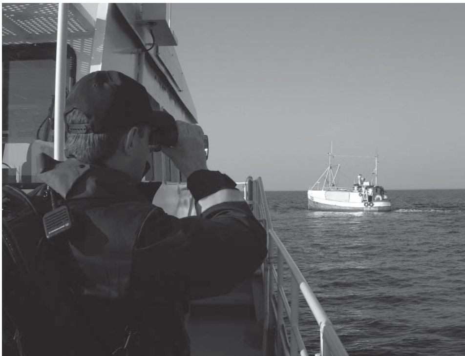
Kustbevakningen på väg att inspektera en fiskebåt.

Organisatoriskt tillhör "vi" region Syd med huvudman i Karlskrona, men Helsingborg har så kallad Kustbevakningsstation med 20 kustbevakare varav 5 är dykare. Öresund, södra Kattegat och södra Östersjön är bevakningsområde. Helsingborgsgruppen har tullverksamhet, sjötrafik, miljötillsyn, fiskeövervakning och kontroll av farligt gods som huvuduppdrag. Dykeriverksamheten är stor på stationen. Man disponerar ett miljö-