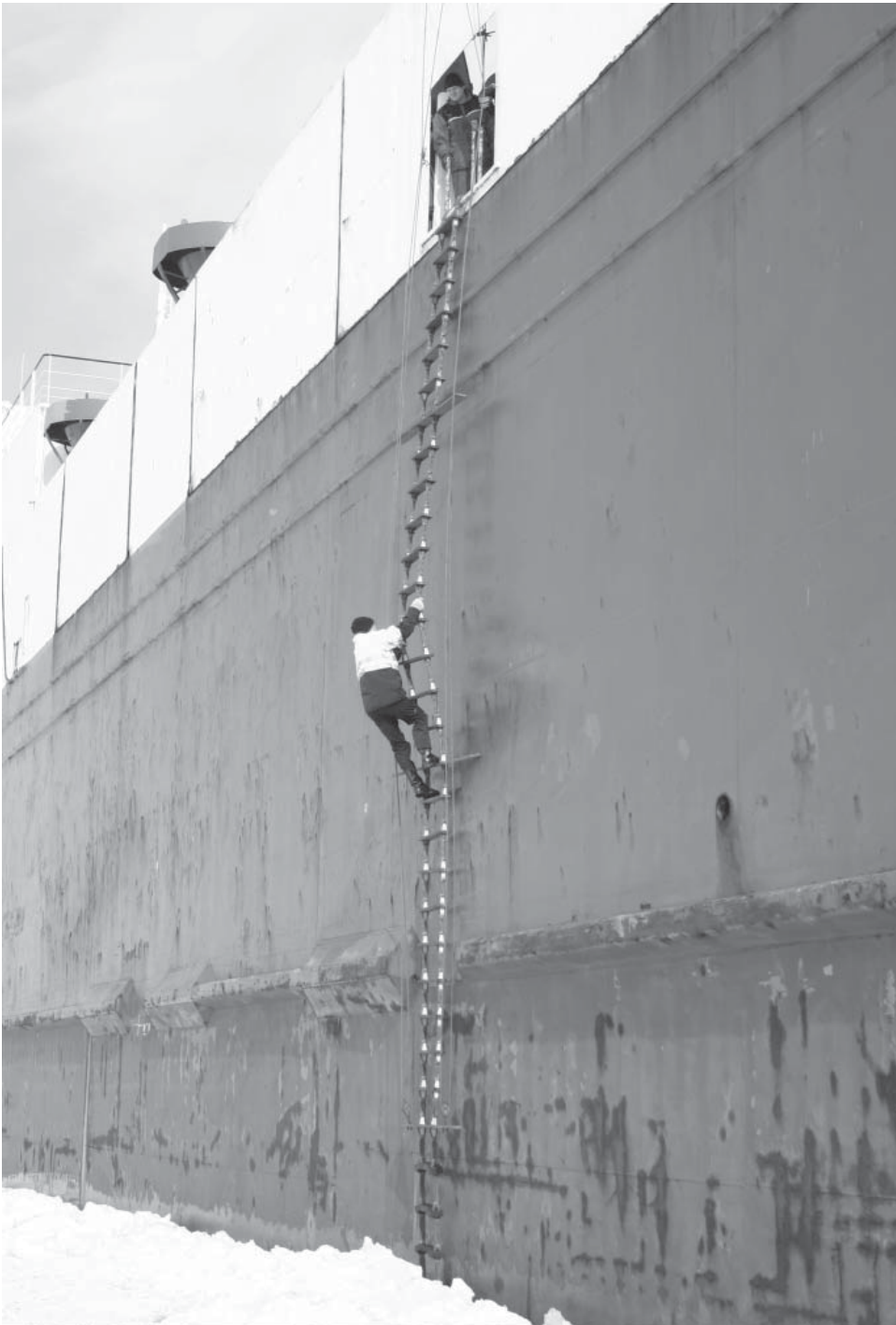
Lotsen går ombord. Undra på att smidighet är en kvalifikation till tjänsten som lots!