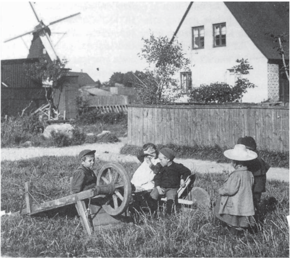
Några av de många barnen på Skepparegatan ca 1900. Det fanns inte mindre än sex tvillingar på gatan! Obs möllan vid Råå Hotell!